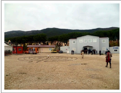
MUSPAC, la nuova sede