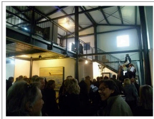
La nuova sede del museo