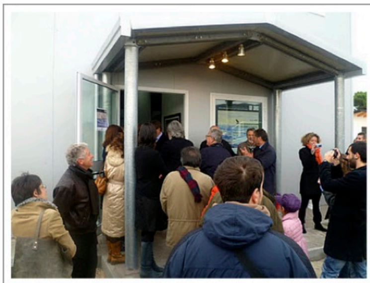
MUSPAC, inaugurazione ufficiale del 6 novembre 2011

In un paese in cui da qualche anno non si fa altro che chiudere musei o tagliare i fondi alla cultura, ogni tanto un segnale positivo ci lascia ben sperare.