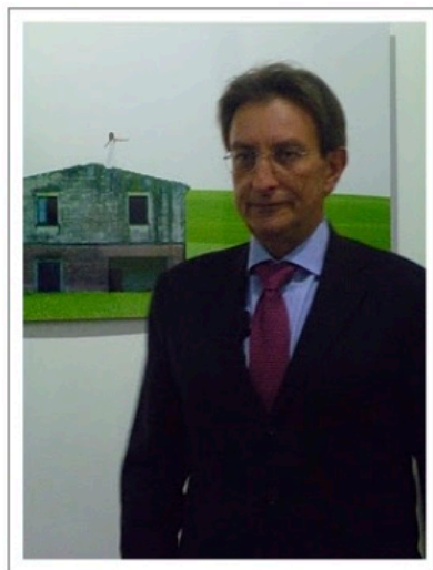
Sindaco dell'Aquila, On. M. Cialente