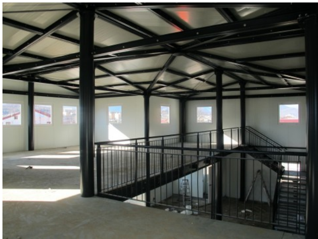
Gli interni del nuovo Muspac

E invece, tra commissari e subcommissari per l'ennesima emergenza sine die , la Basilica di Collemaggio sta in piedi ancora a metà (la facciata riuscì a salvarsi grazie alle impalcature, perché sottoposta a restauro nel periodo del sisma). Certo, la Fontana delle 99 cannelle è tornata a zampillare grazie al Fai, ma la campagna di adozione dei monumenti lanciata da Berlusconi durante il GB (la "lista di nozze") non ha avuto il successo sperato: solo il Kazakistan ha già versato i soldi per l'oratorio di San Giuseppe dei Minimi; recente l'impegno della Russia per Palazzo Ardinghelli e la chiesa di San Gregorio Magno, ma la Francia di Sarkozy nicchia sui fondi promessi per la chiesa delle Anime Sante.