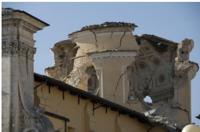
La cupola della chiesa delle Anime Sante

È quanto sta accadendo all'Aquila, due anni dopo quella terribile notte del 6 aprile, anche se pochi lo sanno. Visto che, spenti i riflettori del G8, dei funerali catodici e dei talk show "sul pezzo", non se ne parla quasi più (e stendiamo un velo sul cinico Forum ). Ogni tanto a smuovere le acque ci provano i comitati civici, il popolo delle cariole. Ma è una goccia nel mare. Perché per far risorgere i tesori del capoluogo abruzzese ci vogliono soldi. Tanti soldi. Quanti? Tre miliardi e mezzo di euro, più o meno. E, col Mibac in profondo rosso, la prospettiva è avvilente, nonostante la promessa dell'ex ministro Bondi di destinare alla regione, oltre ai fondi ordinari, anche l'1% dei fondi Arcus per dieci anni.