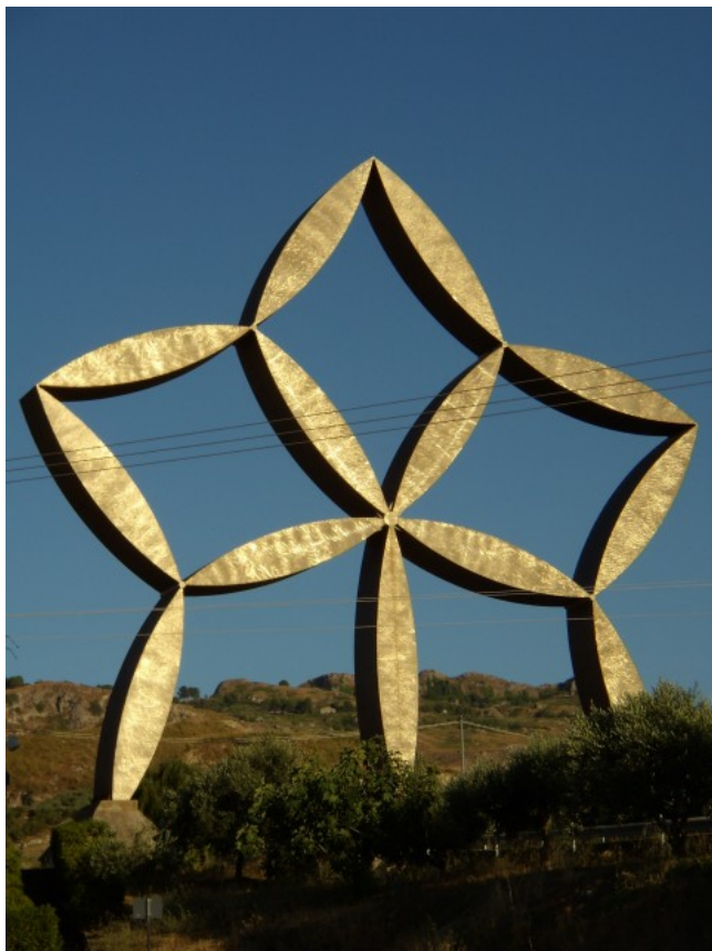
La stella di Pietro Consagra a Gibellina

E invece, tra commissari e subcommissari per l'ennesima emergenza sine die , la Basilica di Collemaggio sta in piedi ancora a metà (la facciata riuscì a salvarsi grazie alle impalcature, perché sottoposta a restauro nel periodo del sisma). Certo, la Fontana delle 99 cannelle è tornata a zampillare grazie al Fai, ma la campagna di adozione dei monumenti lanciata da Berlusconi durante il GB (la "lista di nozze") non ha avuto il successo sperato: solo il Kazakistan ha già versato i soldi per l'oratorio di San Giuseppe dei Minimi; recente l'impegno della Russia per Palazzo Ardinghelli e la chiesa di San Gregorio Magno, ma la Francia di Sarkozy nicchia sui fondi promessi per la chiesa delle Anime Sante.