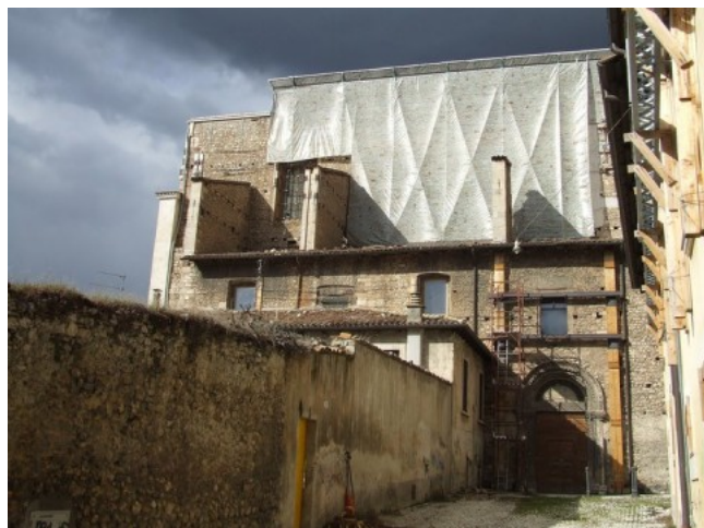
La facciata della chiesa Santa Maria Paganica