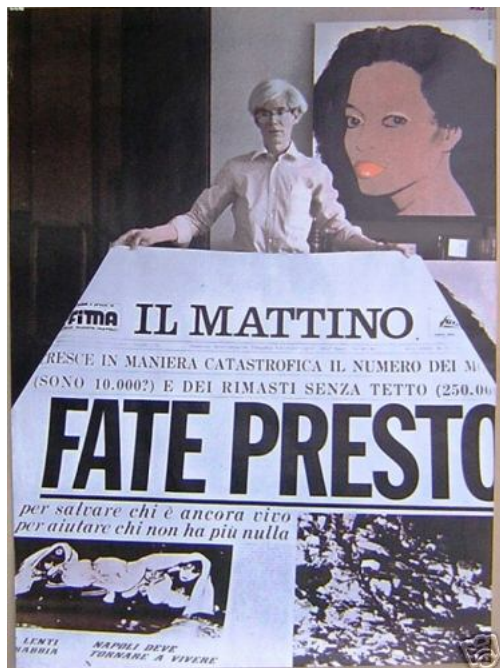
Andy Warhol – Fate presto – opera realizzata per Terrae Motus

Ma, si sa, l'Italia non è il Giappone: qui le ricostruzioni vanno a rilento, nella migliore delle ipotesi. Perché nella peggiore sorgono le cattedrali nel deserto, rose dalla ruggine ancora sigillate, ridotte in poltiglia al primo acquazzone; oppure vanno all'arrembaggio la malapolitica, le infiltrazioni criminali, i "furbetti" appostati come sciacalli. E le macerie restano lì, polvere coperta da polvere.